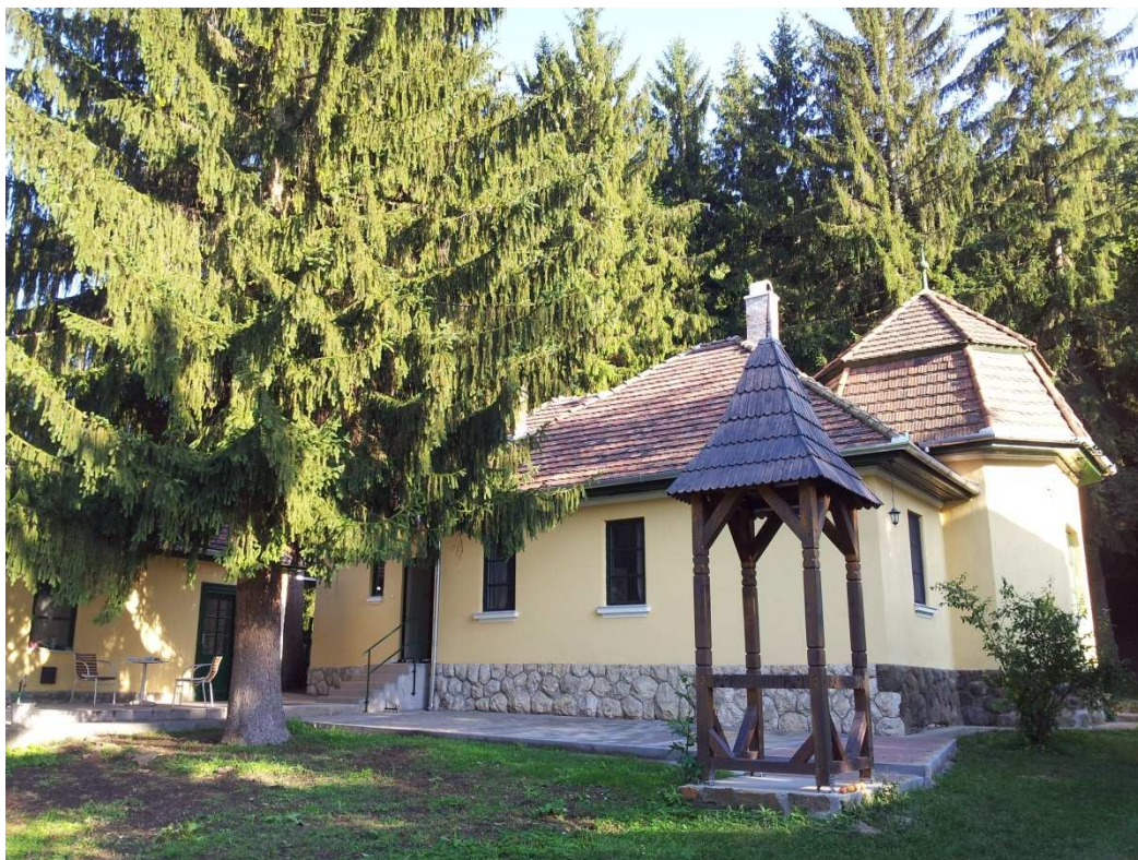
Fenyőliget Vendégház kert felőli képe

A Vendégház mögött egy 40 m 2 alapterületű, térkővel burkolt terasz került kialakításra, ahol a melléképületben található fa asztalok és padok helyezhetőek el, mellyel jó idő esetén a terület ideális terévé válik szabadtéri étkezéseknek vagy bármilyen más közösségi együttlétnek.